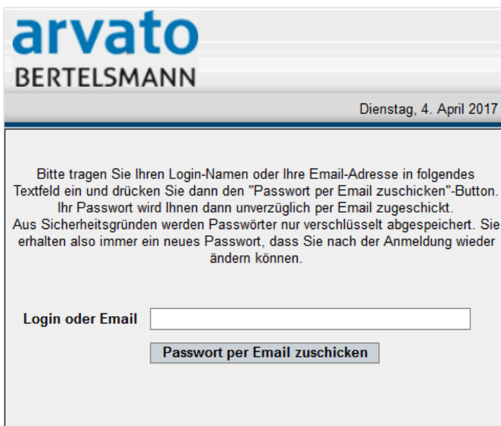
Abbildung 3 – Neues Passwort erhalten

Mit dem Anklicken öffnet sich ein neues Fenster. Bitte tragen Sie hier Ihren Benutzernamen ein oder Ihre E-Mailadresse. Beenden Sie diesen Vorgang durch „Passwort per Email zuschicken“ (Abbildung 3). Dann wird Ihnen ein neues Passwort an die E-Mailadresse zugeschickt bzw. an die Adresse, die bei dem Benutzernamen hinterlegt ist.