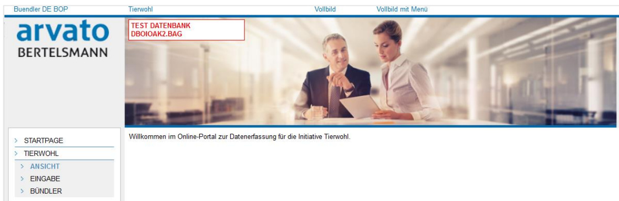
Abbildung 7 Startseite Tierwohl Bündlermaske