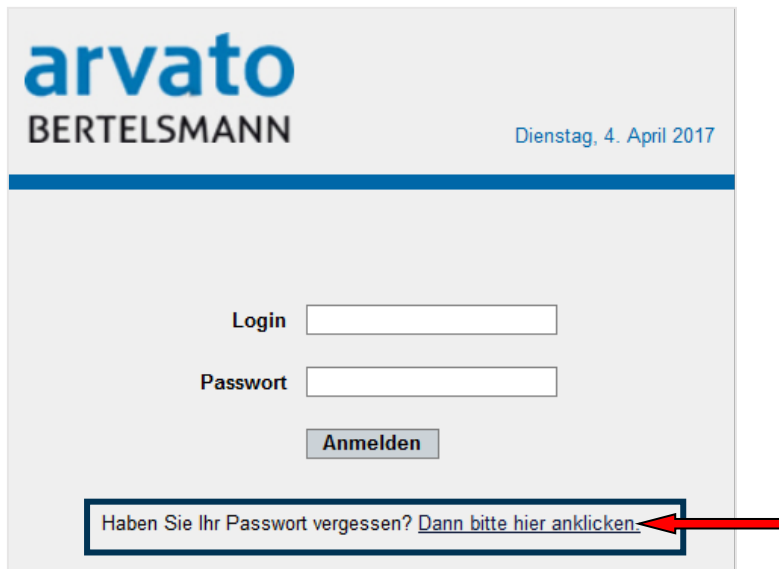
Abbildung 2 – "Passwort vergessen" - Funktion

Wenn Sie Ihr Passwort vergessen haben sollten, können Sie dieses über die Funktion „Passwort vergessen“ (Abbildung 2) abrufen.