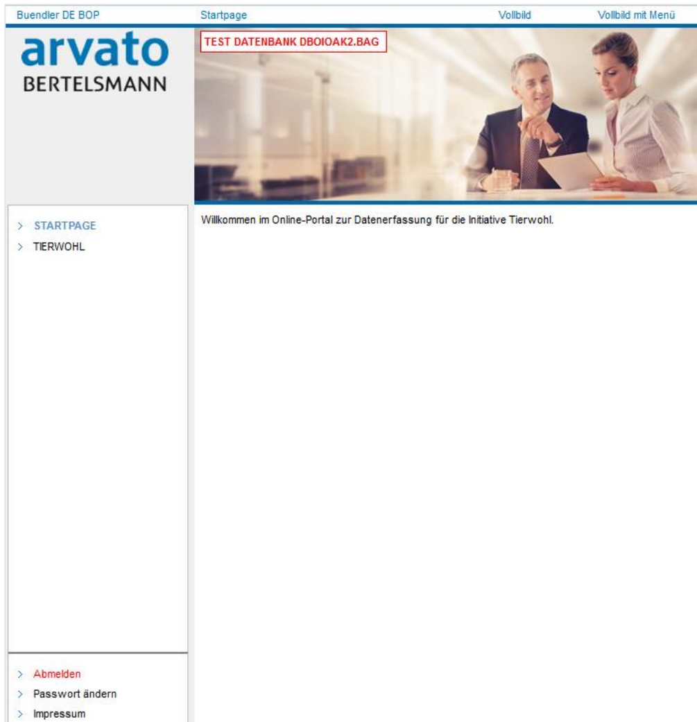
Abbildung 6 - Startseite

Nach einer erfolgreichen Anmeldung in BOP ist das die Startseite der Datenbank