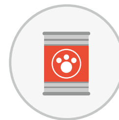
Verarbeitetes Heimtierfutter, in Dosen und anderen Behältnissen