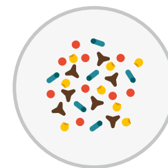
Trockenfutter & Snacks